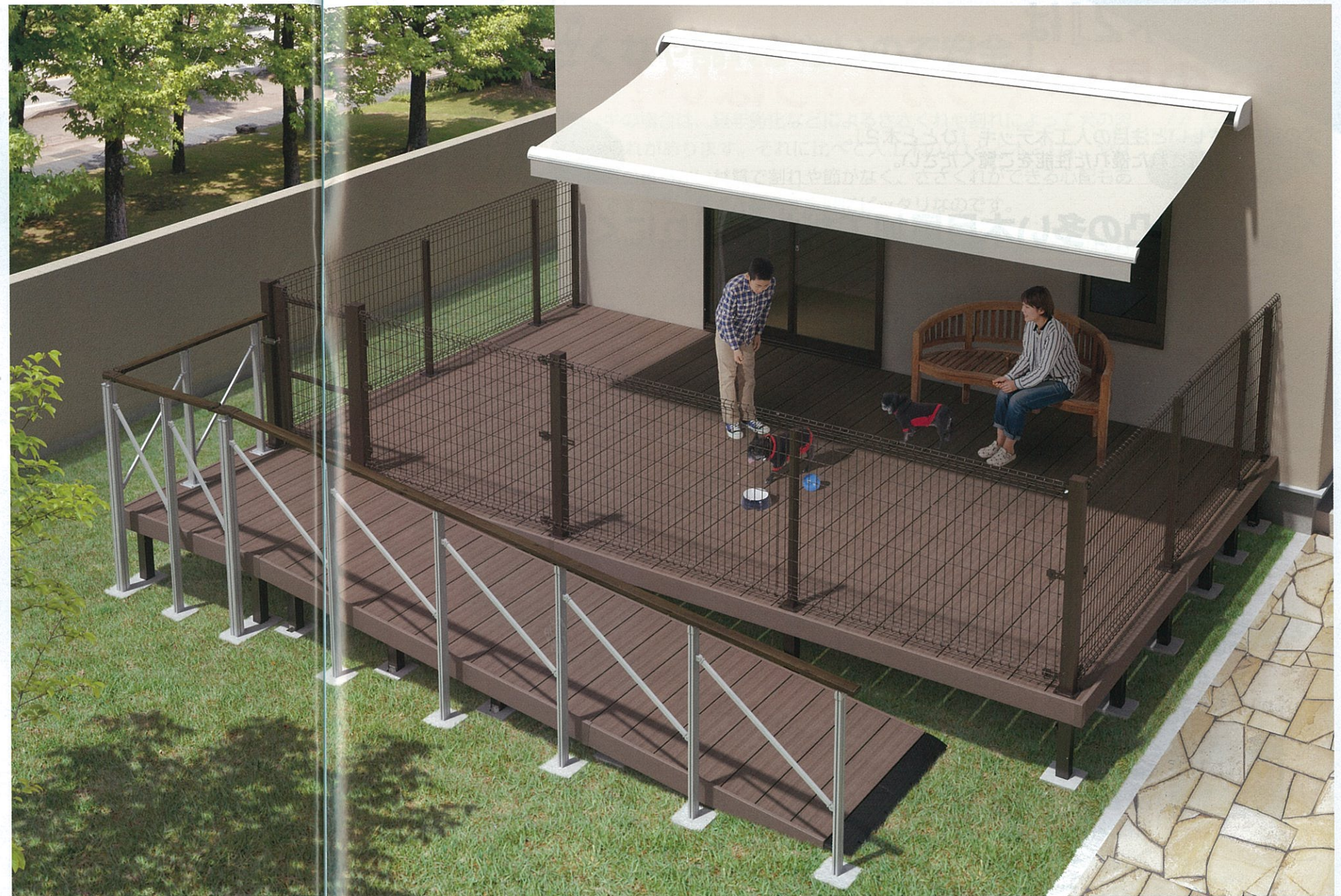
デッキを楽しくに駆けまわる愛犬の姿を眺めていると、時間が経つのを忘れてしまいそうです。

人工木デッキをドッグランとして活用。土の庭の場合は穴掘りをしたり、転げまわると体や足が汚れがちですが、人工木デッキならそんな心配は不要。デッキのまわりをフェンスで囲えば飛び出しを防ぐこともでき安全です。また、スロープを設置することで、人とペットと一緒に上り下りできます。お散歩に出かける際にも便利です。