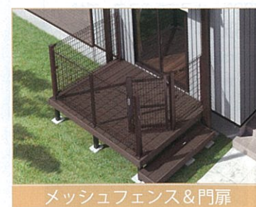
メッシュフェンス&門扉

犬がフェンスの上を飛び越えたり、下部のすき間をくぐり抜けることができにくいサイズに設定しています。門扉の錠は市販の南京錠も取り付けが可能です。