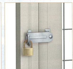
打ち掛け錠でしっかり施錠ができます。