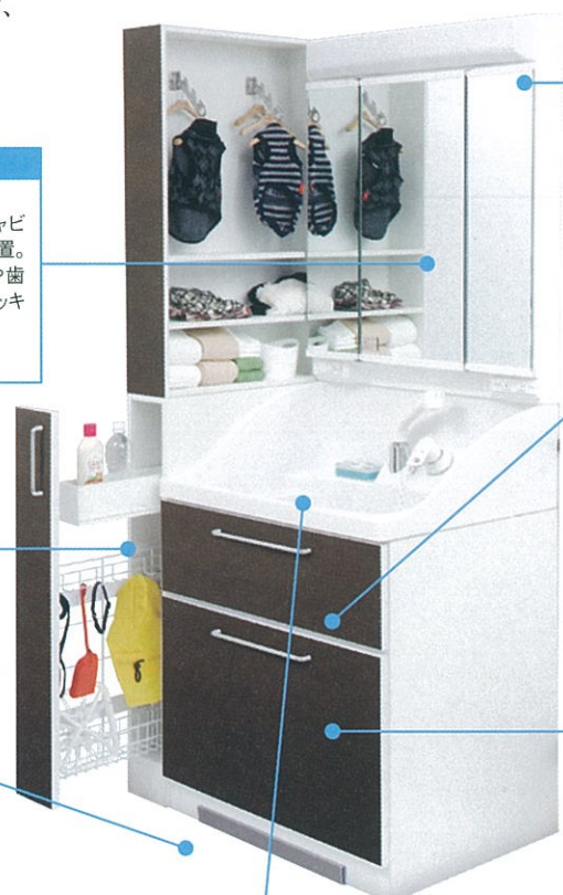
※写真：木目仕様 [ダーク]